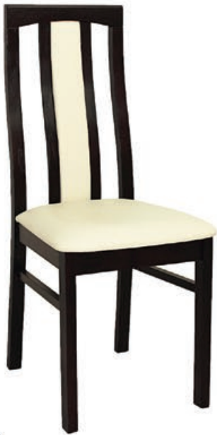
BR-11 s143 g141 w197