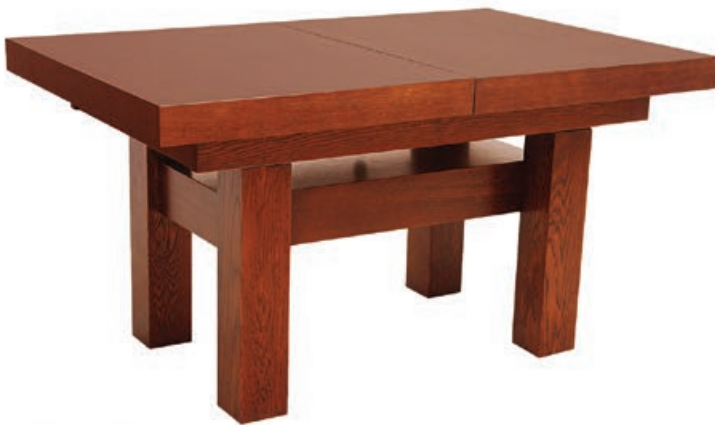
JPR-7 s 170 d 110-150 w 62-75 s 175 d 140-220 w 62-75