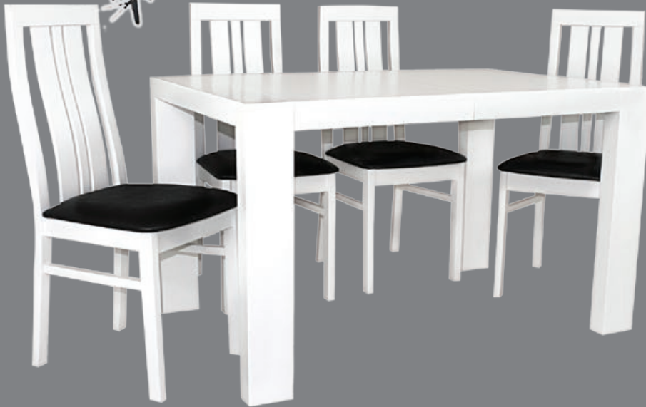
VERA s180 d1125-225 w176