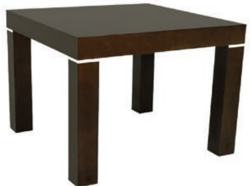
ŁW-010 s170 d170 w155 s170 d110 w155