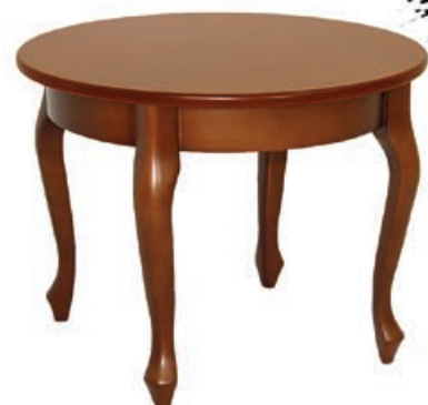
MICHAŁ-4 s1070 d170 w147 s1080 d180 w160