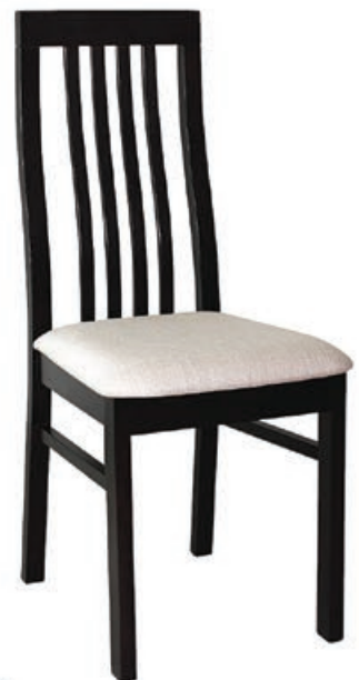
BR-22 s143 g141 w197