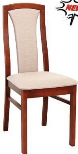
BR-25 s143 g141 w197