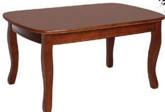
FRYDERYK s160 d190 w147 s170 d110 w160