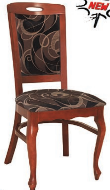
LU-02 s146 g143 w1100