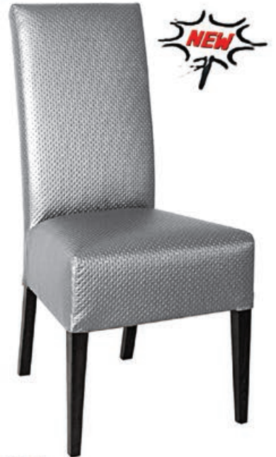
MODENA s147 g141 w101