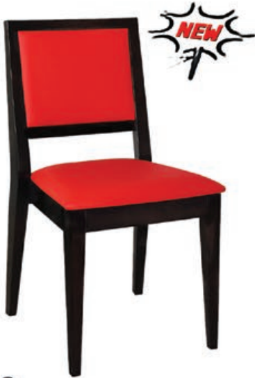
DIEGO s144 g143 w186