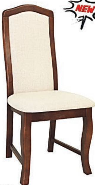
WIKTOR s146 g141 w199