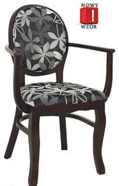
RYSZARD-2 s146 g143 w196