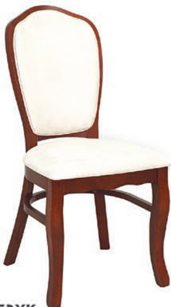
FRYDERYK s146 g143 w199