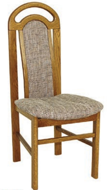
JOACHIM s146 g143 w1106