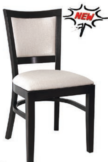
AR-14 s144 g140 w185