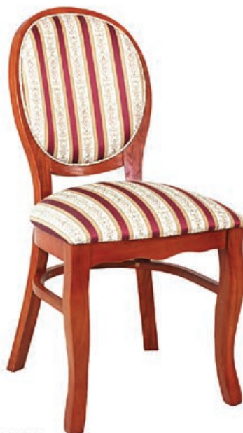
RYSZARD s146 g143 w196