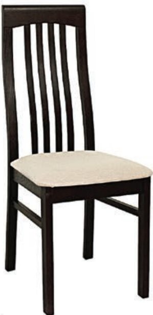
BR-17 s143 g140 w199