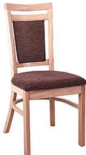
AR-9 s146 g143 w197