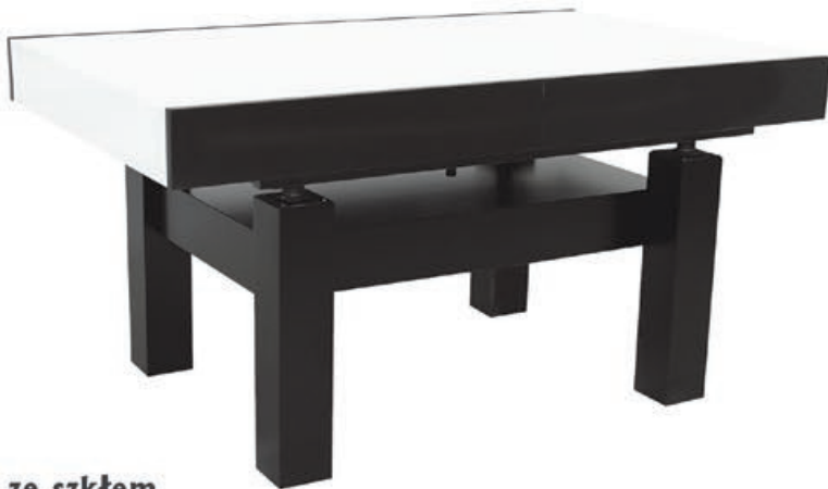
JPR-4 ze szkłem s 175 d 120-170 w 62-75