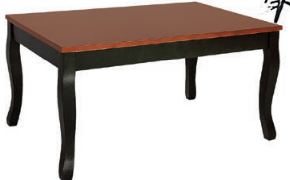
CARLO s160 d190 w147 s170 d110 w160