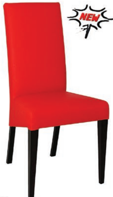
ROMA s147 g141 w101