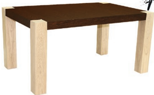
PEDRO s160 d1100 w155