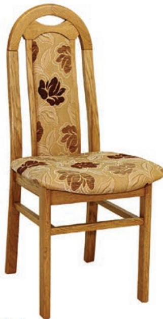
OWAL-1 s146 g143 w1100