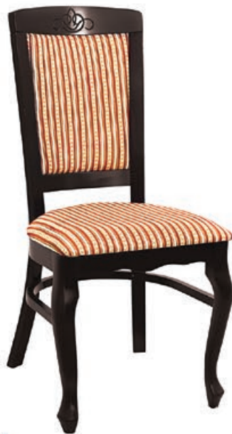
LU-01 s146 g143 w1100