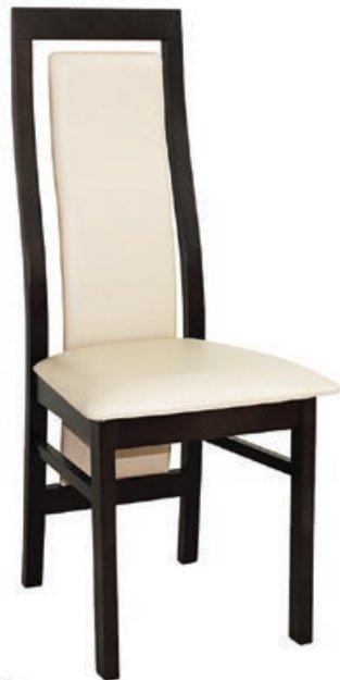
BR-20 s144 g141 w1106