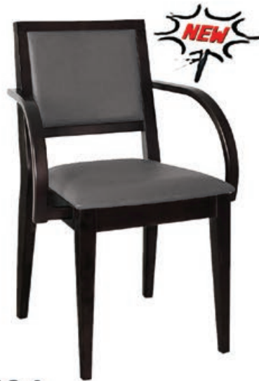
DIEGO-2 s144 g143 w186