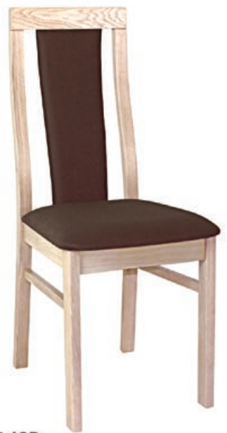
BR-15/SP s143 g140 w197