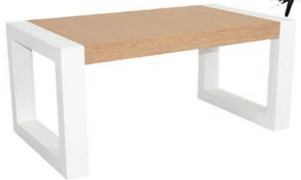
VERONA s160 d110 w150