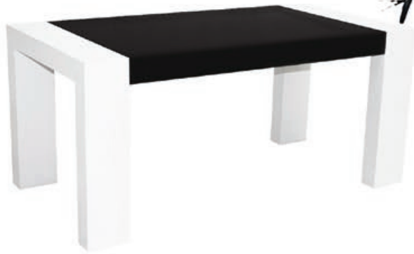
VERA s155 d110 w150