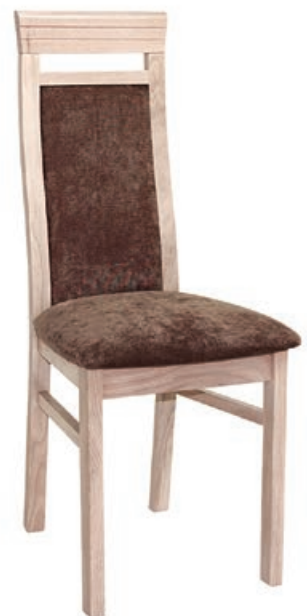
FB-01 s143 g140 w199