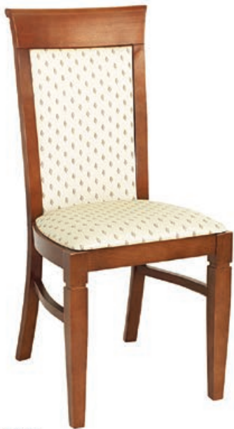
EDWARD s142 g140 w197