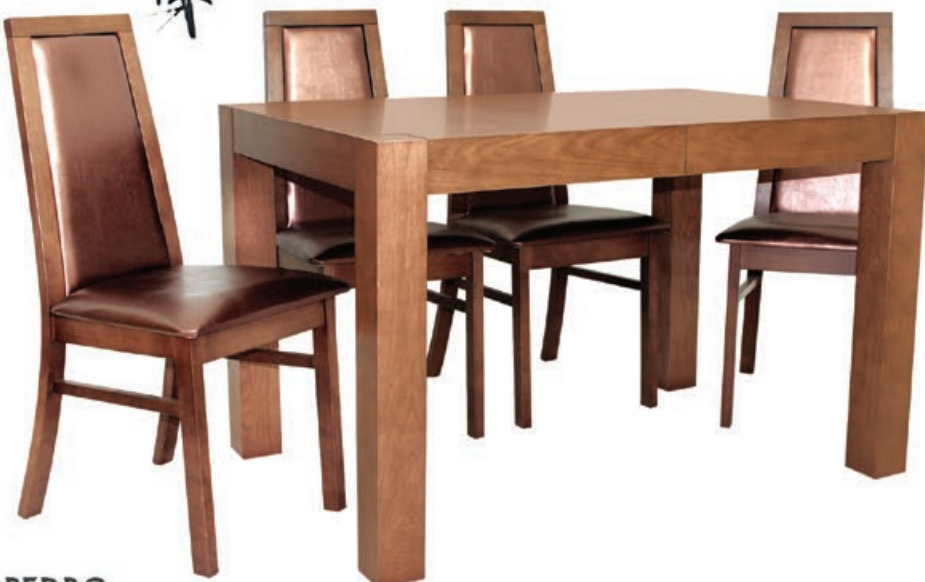
PEDRO s180 d1120-220 w176