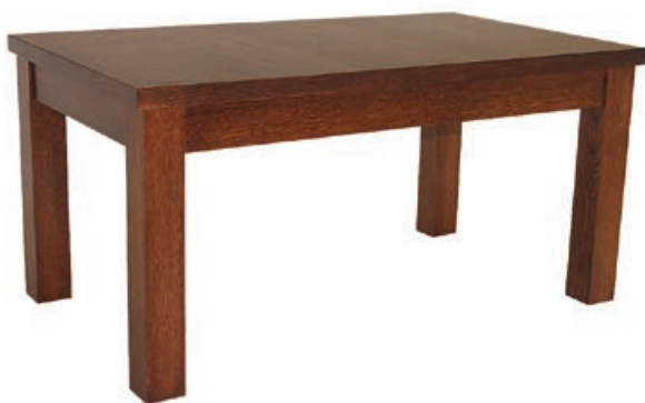
ST-7 s170 d170 w150 s170 d1120 w150