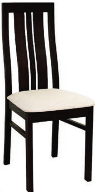
BR-23 s143 g141 w197