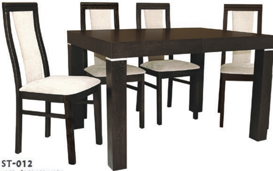
ST-012 s190 d190-190 w176 s190 d1120-220 w176 s190 d1120-300 w176 prowadnica z podpora