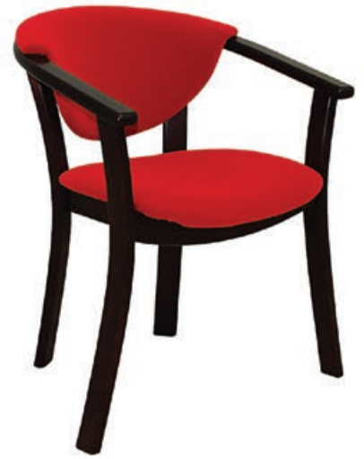
AR-5 s158 g143 w174