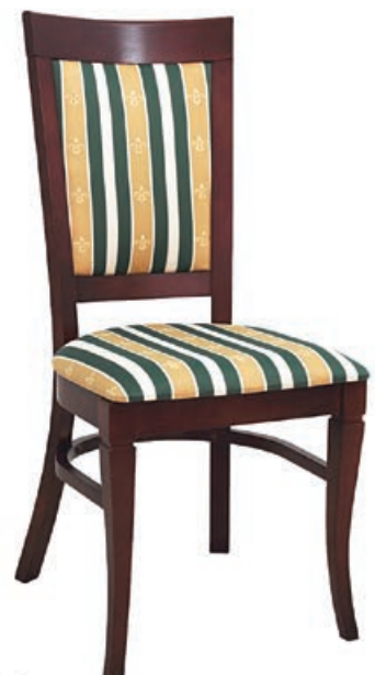
HEROS s146 g143 w100