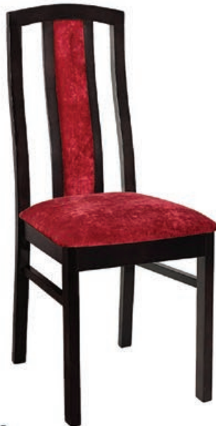
BR-12 s143 g141 w197