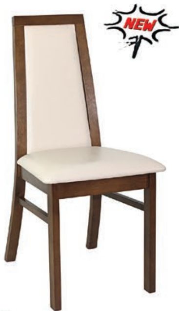
AR-15 s144 g140 w195